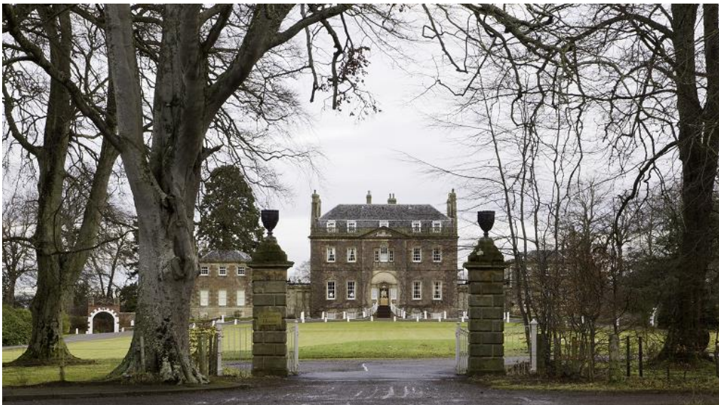
La Culloden House qui se trouve ici aujourd'hui a été construite dans les années 1780, après la bataille.

Culloden House servit de quartier général et de logement à Bonnie Prince Charlie avant la Bataille de Culloden. La maison qui s'y trouve aujourd'hui fut construite quelque 40 ans après ces tristes événements. Une description de la maison précédente la présente comme un « édifice simple de quatre étages, avec une façade crénelée et une tourelle centrale pour la cloche ».