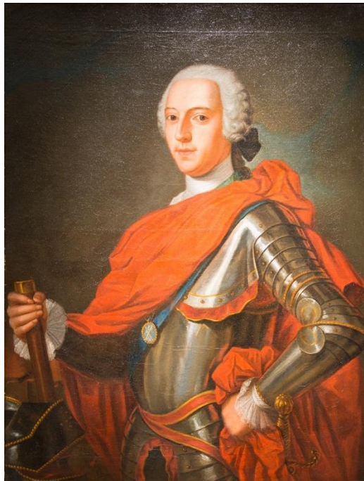
Portrait du Jeune Prétendant (Bonnie Prince Charlie) dans la chambre Mary du Château d'Édimbourg.

Lorsque le roi exilé Jacques VII mourut en 1701, son fils Jacques François Édouard Stuart, catholique, (surnommé "le Vieux Prétendant") reprit la cause pour restaurer sa lignée. Ses tentatives furent également infructueuses, mais démontrèrent qu'il restait un soutien significatif pour « le Roi d'Outre-Manche ». La cause fut ensuite reprise par le petit-fils de Jacques VII, Charles Édouard Stuart – également connu sous le nom de « Jeune Prétendant » ou « Bonnie Prince Charlie ».