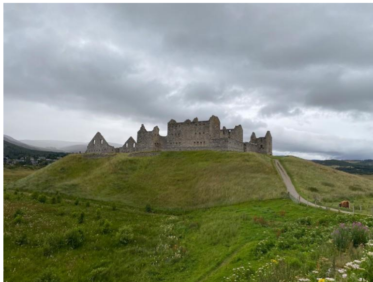
Caserne de Ruthven

« Que chaque homme cherche son propre salut du mieux qu'il peut. »