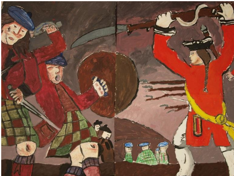
Une fresque murale de la bataille de Culloden à Fort George.

Les MacDonald et d'autres sur le flanc gauche jacobite furent les derniers à avancer, partant d'encore plus loin de la ligne gouvernementale. Avant qu'ils ne puissent l'atteindre, des tirs nourris les arrêtaient avec force dans leur élan.