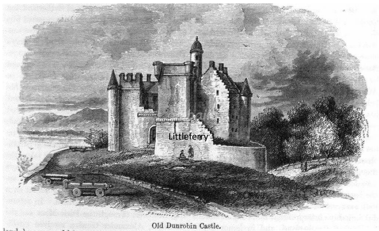
Old Dunrobin Castle.

Littleferry est une bataille souvent oubliée qui s'est déroulée au nord d'Inverness, à l'extérieur de la ville de Golspie. Des Jacobites commandés par le comte de Cromartie furent envoyés prendre le château de Dunrobin et capturer le comte de Sutherland.