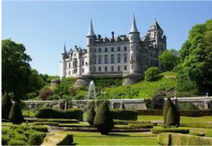
Château de Dunrobin de nos jours