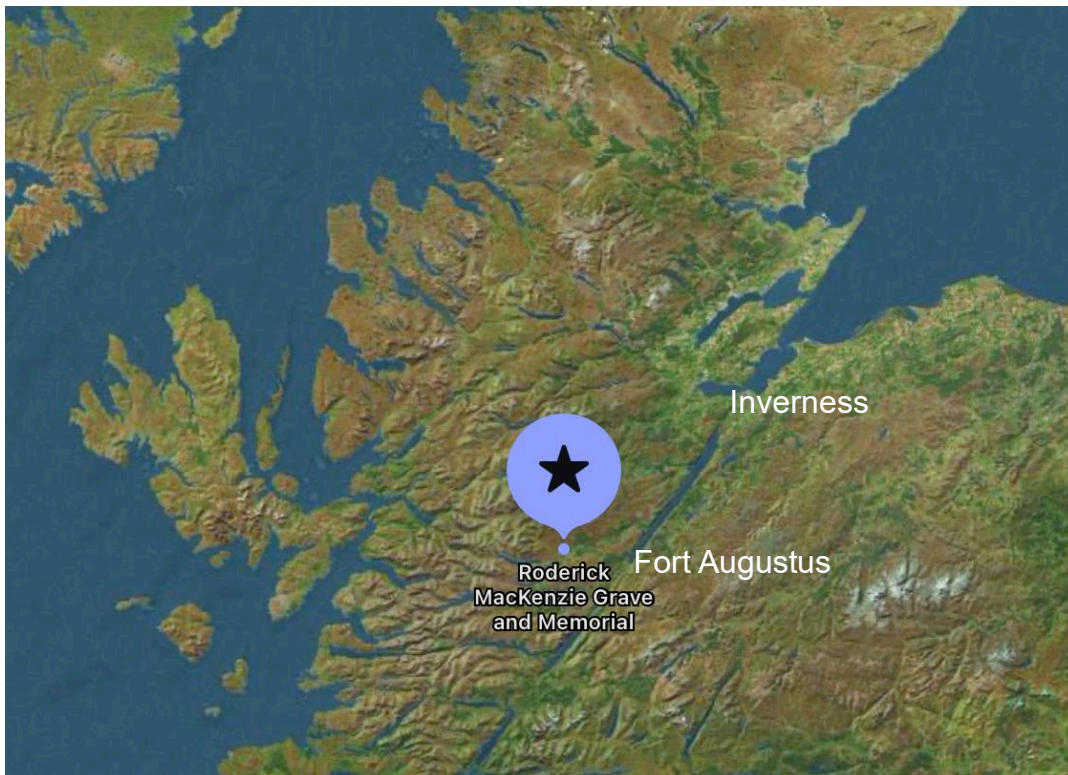
Tombe et mémorial de Roderick MacKenzie

Les soulèvements jacobites sont souvent très romancés par les auteurs, mais qui peut les blâmer quand on sait que des personnages comme Roderick MacKenzie ont existé et que l'on connaît les sacrifices qu'ils ont consentis pour une cause à laquelle ils croyaient.